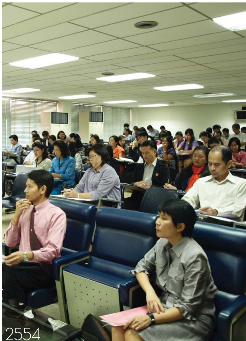
การพัฒนานุเคราะห์การวิจัยประจำปี 2554