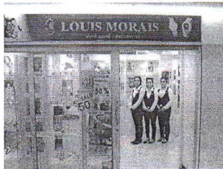
ภาพประกอบที่ 1 โซว์รูมบริษัท

ให้วางภาพประกอบใกล้ตำแหน่งที่อ้างถึงในบทความ พิมพ์ชื่อและลำดับของภาพประกอบได้ภาพ กลางหน้ากระดาษ พร้อมคำบรรยายได้ภาพ ภาพที่ใช้ควรเป็นภาพขาวดำ