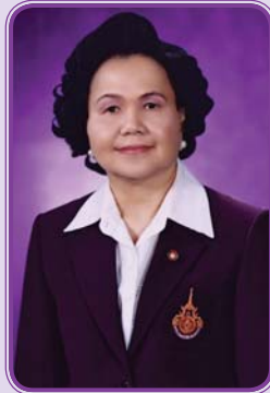
รศ.ดวงสุดา เตโชติรส อธิการบดี